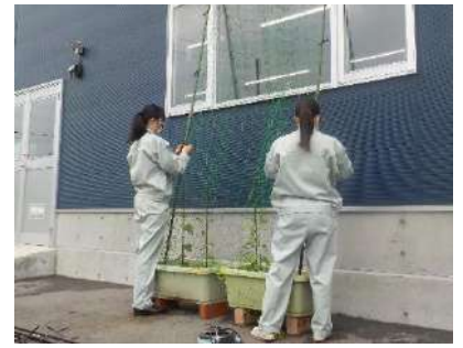
グリーンカーテン設置も手伝って貰いました。