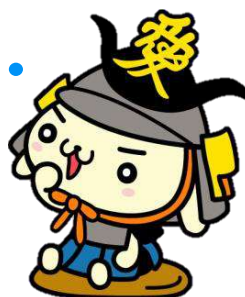
米沢市マスコットキャラクター かねたん

昔はクーラー無しでも生活できていましたし、夏場も校庭で普通に部活していたと考え、気温の上昇をひしひしと感じてしまいます。